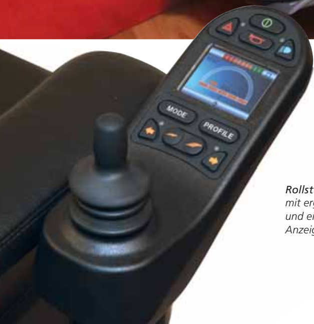
Rollstuhlbedienung mit ergonomisch geformtem Joystick und einer leicht verständlichen LCD- Anzeige.