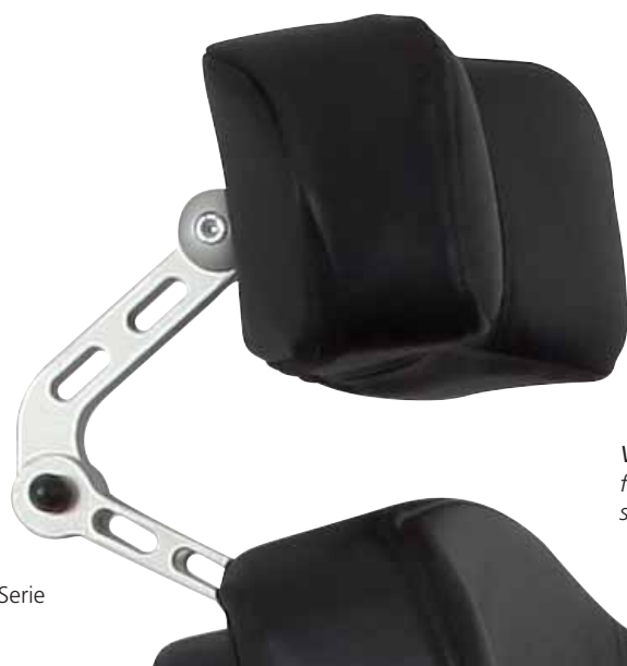
Verstellbare Kopfstütze für höchsten Komfort und sicheren Halt.

Familie, Freunde und Service-Personal werden von der Vielzahl praktischer Anwendungsmöglichkeiten profitieren, Ihre Interaktion mit Familie und Kollegen wird erleichtert. Alltägliche Bewegungen wie Änderung der Sitzposition oder Aufstehen (Etac E890/895) sind kraftunterstützt, und die hochklappbaren Armlehnen sowie die Rollstuhlbedienung mit schwenkbarem Arm bieten ein Maximum an Bewegungsfreiheit.