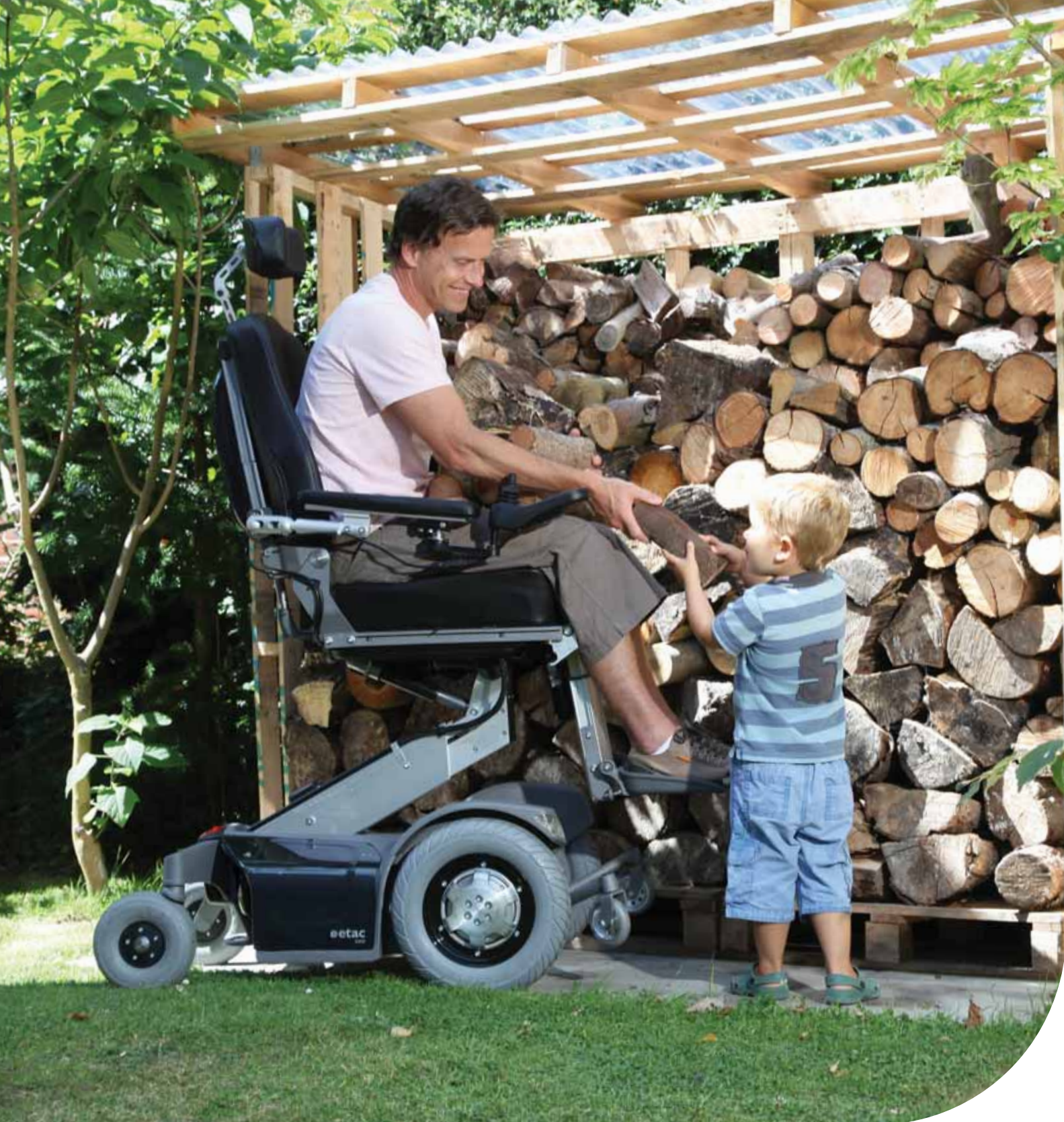
Etac E800 Elektro-Rollstuhl Serie